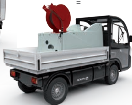
Bewässerung / Hochdruckreiniger